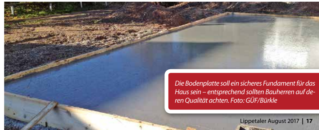
Die Bodenplatte soll ein sicheres Fundament für das Haus sein – entsprechend sollten Bauherren auf deren Qualität achten.