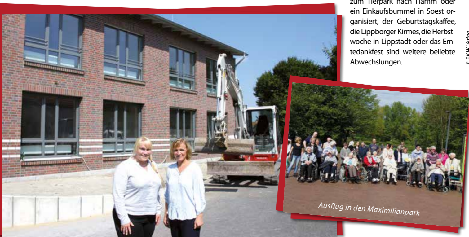
Ausflug in den Maximilianpark