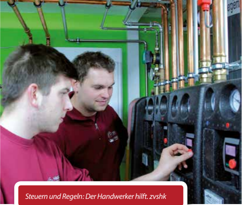
Steuern und Regeln: Der Handwerker hilft. zvszh