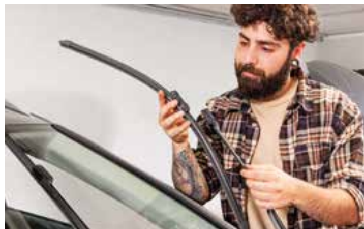
Ein Austausch der Scheibenwischer ist zum Start in die Herbst-Winter-Saison empfehlenswert.

Wenn es früh dämmt sowie Regen und Nebel für schwierige Sichtverhältnisse sorgen, sollten sich Autofahrer auf die Technik verlassen können. Ein vorausschauender Herbstcheck, wie ihn viele örtliche Kfz-Fachwerkstätten anbieten, kann möglichen Problemen vorbeugen. Licht, Bremsen, Reifen, Flüssigkeitsstände, die Batterien und mehr werden dabei überprüft – und, falls nötig, gleich instandgesetzt.