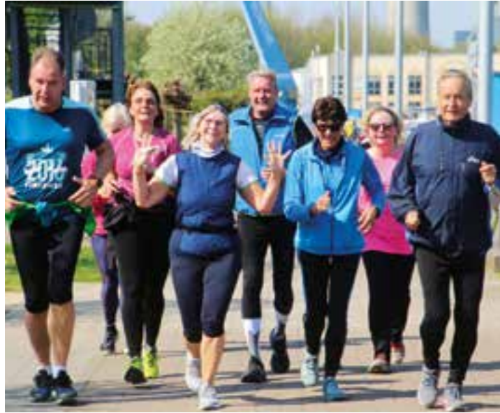
In einem Sternlauf erreichten die Läufer:innen die Marina Rünthe.

Tolles Ambiente für Eröffnung der Lauf- und Walkingsaison