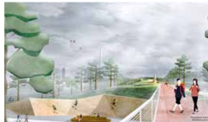
Entwurf Bergwelten für die „Haldenlandschaft am Kanal“ in Bergkamen zur IGA 2027. Foto: ©GREENBOX Landschaftsarchitekten

„Die IGA 2027 ist ein wesentliches Element des Strukturwandels und wird vielen Menschen