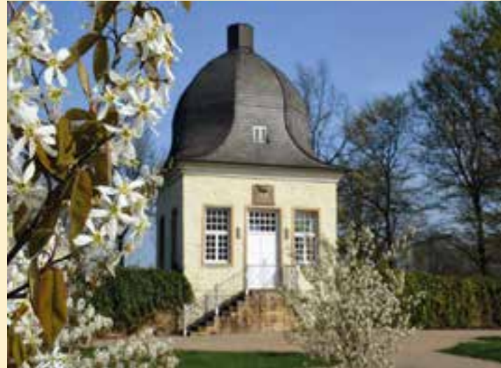
Haus Opherdicke

Sportlich in die Freiluft-Saison starten