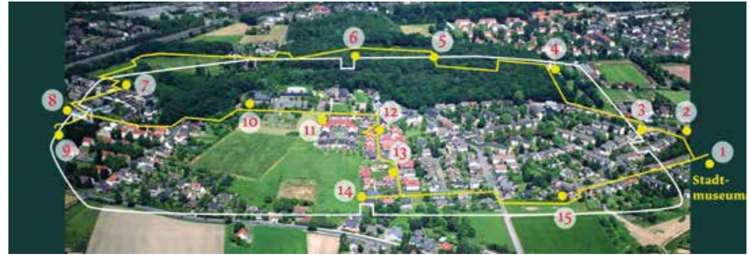
Luftbild historisches Römerlager.

Gespenster-Cake-Pops: Der erste Schritt ist hierbei der gleiche wie bei den Mumien. Während die Schokolade trocknet, wird das Fondant etwa 0,5 cm dick ausgerollt und mithilfe einer Schüssel / eines Glases in ca. 15 cm große Kreise ausgeschnitten. Diese werden dann mittig auf den Cake-Pop gelegt und so gezogen, bis die Form des Gespenstes gefällt. Zum Abschluss werden die Augen noch mit der flüssigen Schokolade angeklebt. (ak-o)