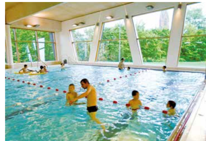
Die Intensivschwimmkurse für Kinder in den Osterferien waren restlos ausgebucht. Das erfolgreiche Konzept will die Bädergesellschaft nun auch im Freibad Cappenberger See während der Sommerferien anbieten.

Der Sommer hat sich im Vergleich zum letzten Jahr lange bitten lassen. Doch am vergangenen Wochenende fiel er nun endlich, der sommerliche Startschuss. Die Bädergesellschaft Lünen eröffnete am 1. Juni 2019 die Freibadttore am Cappenberger See.