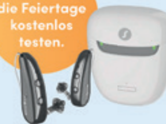
Die neuen Mini-Hörgeräte von Signia für brillantes Hören und Verstehen.

Jetzt kostenlos und unverbindlich über die Weihnachtsfeiertage testen bei: