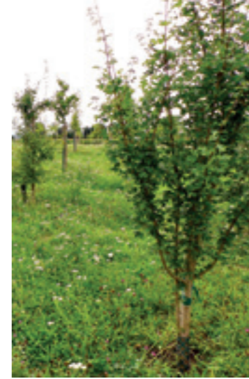
Der Bürgerwald in Südkamen.

pflanzung des Südkamener Bürgerwaldes abgeschlossen und mit der Unterstützung von 390 Baumpatinnen und Baumpaten ein neuer Wald auf Kamener Stadtgebiet entstanden sein. Die Anzahl der jährlichen Bestellungen und die Begeisterung der Bürgerinnen und Bürger für die Aktion „Bürgerwald“ ist seit der ersten Pflanzaktion im Jahr 2017 stets konstant geblieben. Aus diesem Grund hat