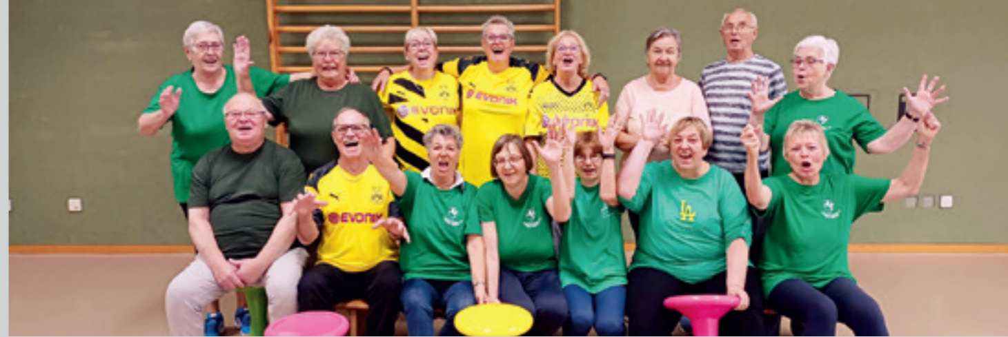
Endlich war es wieder so weit: Nach dreijähriger Corona-bedingter Pause konnten fünfzehn Senioren des Schwimmvereins Westick-Kaiserau aus Kamen-Methler wieder für drei Tage in die Willy-Weyer-Sportschule in Hachen reisen. Nach dem Aktivprogramm wie Sturzprophylaxe, Trommeln, Gymnastik, Kegeln und Spaziergängen in der Umgebung ließ man die Tage in der hauseigenen „Tenne“ fröhlich ausklingen.