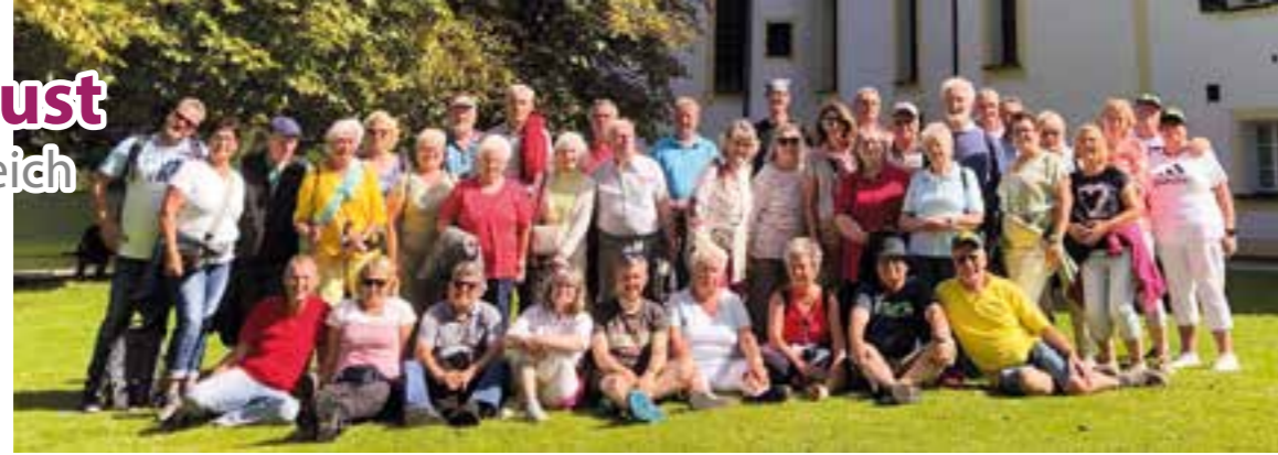
Ausflug zur Wallfahrtskirche St. Bartholomä.

Es hatte sich bereits bei dem tollen Ausflug im vergangenen Jahr nach Filzmoos abgezeichnet, dass