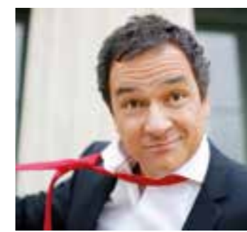
Kabarettist Stephan Bauer.

Gerade erst geht die Festwoche anlässlich des 100-jährigen Bestehens, das „Kurler Volksfest“ mit „Gänseköpfen“, Party und Festumzug zu Ende, da stehen aber auch schon die nächsten Highlights im Kalender der Kolpingsfamilie Husen-Kurl an.