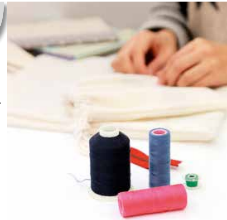
Auch Nähkurse sind wieder im Angebot.