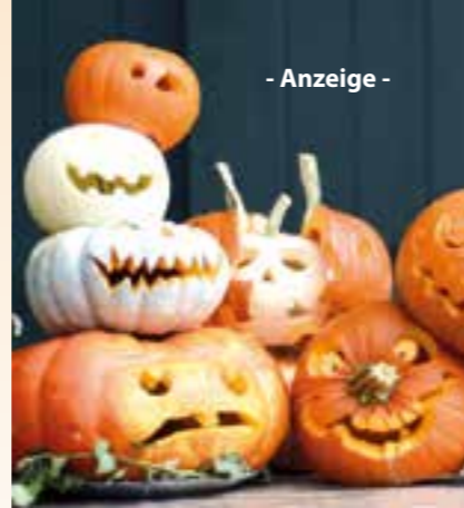
- Anzeige -

zember sorgt der beliebte Weihnachtsmarkt in der Scheune bei Ligges wieder für viel Vorfreude