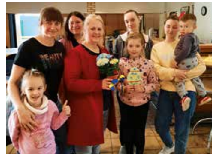
Ukrainische Besucherinnen im Bürgerhaus.

Damit in den vergangenen Osterferien bei den daheimgeliebten Kindern keine Langweile aufkommen sollte, hatte sich das Team des Bürgerhauses Methler wieder einiges einfallen lassen.