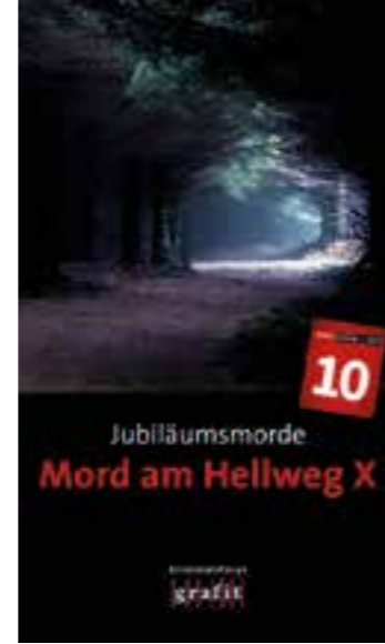
Cover Mord am Hellweg X

Krimi-Fans aufgemerkt! Der neue Band der „Mord am Hellweg“-Anthologie ist erschienen – ein ganz besonderer, denn es ist der Zehnte. Damit gehört die „Mord am Hellweg“-Kurzkrimisammlung zu den Dauerbrennern deutschsprachiger Krimianthologien-Reihen – vermutlich ist sie die derzeit älteste überhaupt.