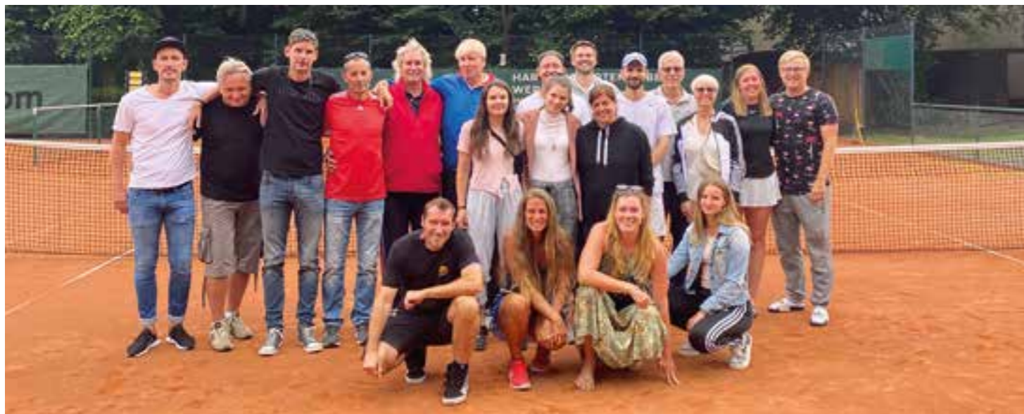
Die glücklichen Gewinner:innen des 9. Methleraner LK-Turniers.

Wieder ein großer Erfolg für die Gastgeber