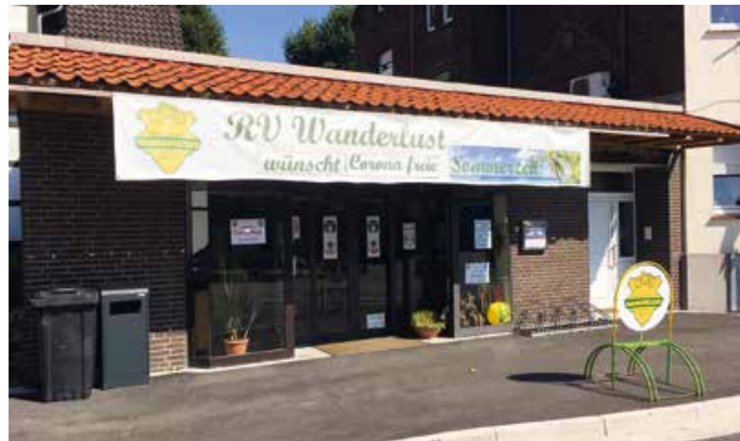
Die Teststelle bleibt auch ohne vorherige Terminvergabe bis 10. Oktober montags bis Freitag von 17 bis 19 Uhr und samstags und sonntags von 11 bis 14 Uhr geöffnet.

Keine Unterstützung für Corona-Leugner und Impfgegner