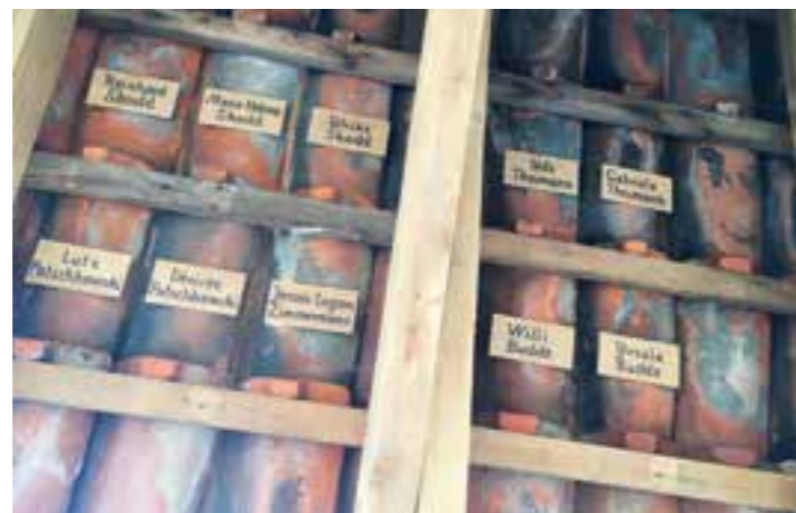
Wer sich gegen Spende im Vereinsheim verewigen möchte, sollte flott sein.