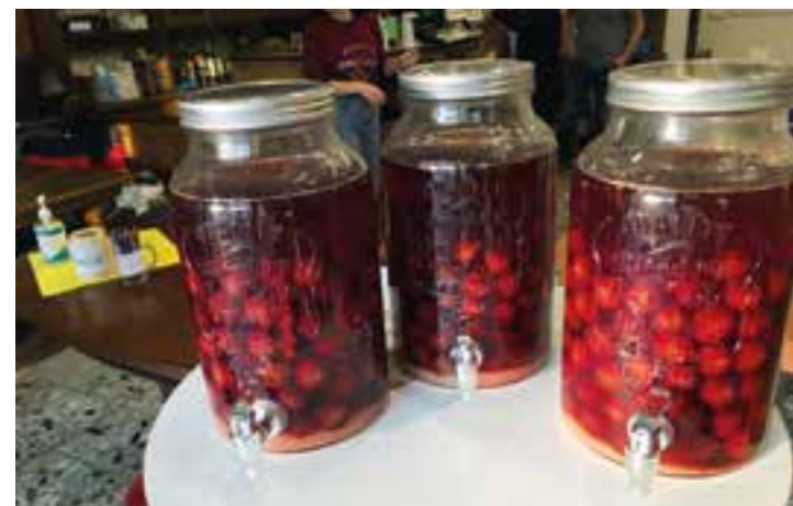
Der Pflaumenschnaps wird pünktlich zum Termin fertig sein. Prost!