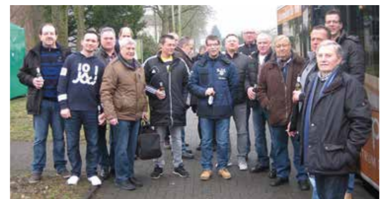
Als erstes Ereignis in diesem Jahr stand die Fahrt ins Trainingslager nach Brilon vom 17. bis zum 19. Februar an.