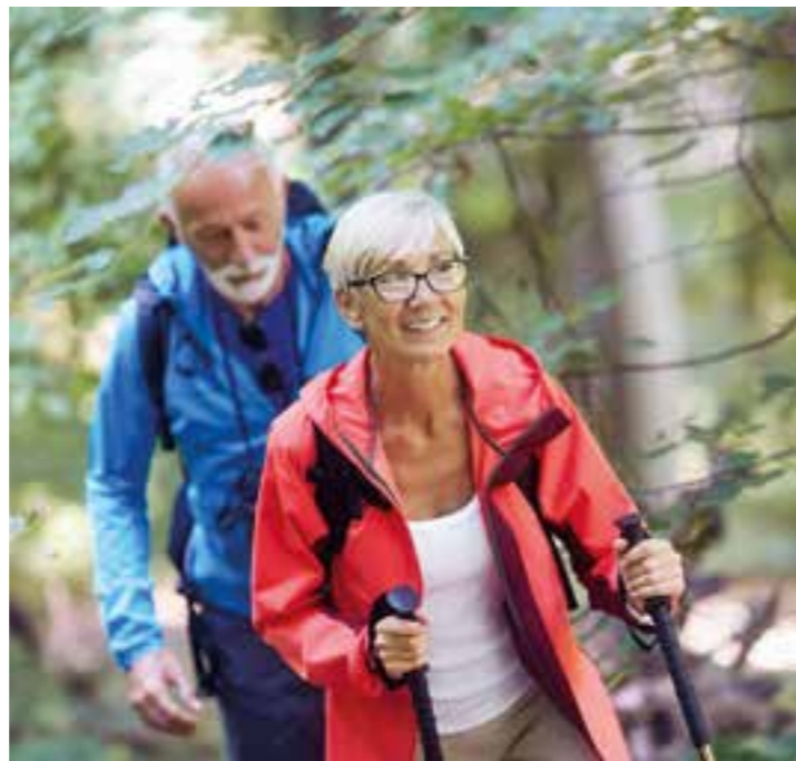
Mit viel Bewegung an der frischen Luft kann man jetzt aktiv gegen Rückenschmerzen angehen.

Das ermöglicht eine großzügige Spende im mittleren vierstelligen Euro-Bereich durch Barbara Wiemann-Ernst, die damit an