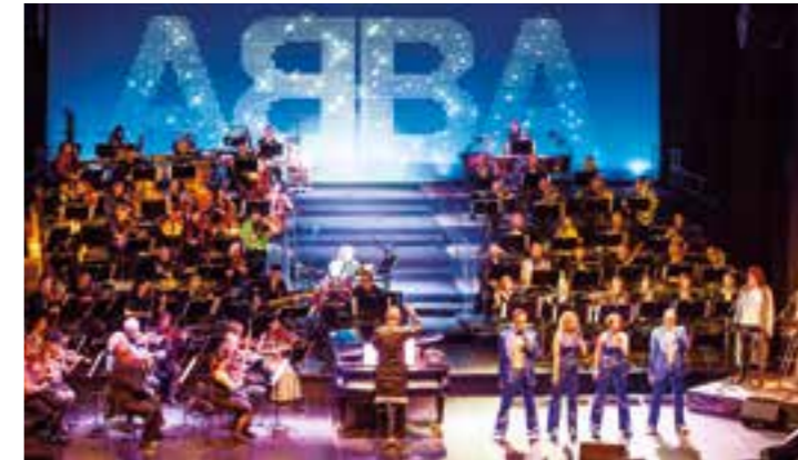
ABBA forever

Mit dem Konzert „ABBA forever!“ lässt die Neue Philharmonie Westfalen (NPW) den Glamour der Siebziger wieder auferstehen. Die Evergreens von ABBA sind sehr beliebt und der Vorverkauf für das große Popkonzert am 26. März ist bereits gestartet. Bei dem beliebten Konzert der Crossover-Reihe „NPW goes ...“ lassen Orchester, Band und Gesangssolisten legendäre