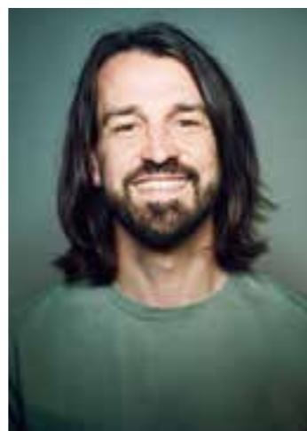
David Kebekus präsentiert Stand-up Comedy „über- ragend“.

onieren kann. Über große Theorien bis zu den kleinen Kämpfen des Alltags. Mit seiner angenehm ruhigen Art präsentiert er unaufgeregt auch gern heftige Aussagen. Hierbei gelingt es ihm immer, eine Verbindung zur Gesellschaft und aktuell diskutierten Problemen herzustellen. Handgemachtes Material, auf Open Mics erarbeitet, ausgefeilt und mit Selbstironie und Herzblut befüllt. Die reinste Form der Unterhaltung. Ein Mikro und viele persönliche Geschichten. Lassen Sie sich erst berieseln und denken Sie dann zu Hause doch noch einmal drüber nach. „Wenn ich eine neue, interessante Perspektive gefunden habe, suche ich gute Pointen dazu, breche das Thema auf seine Essenz herunter und beleuchte alle Seiten mit möglichst vielen weiteren Witzen. Dann geht's zum nächsten Thema. Das ma-