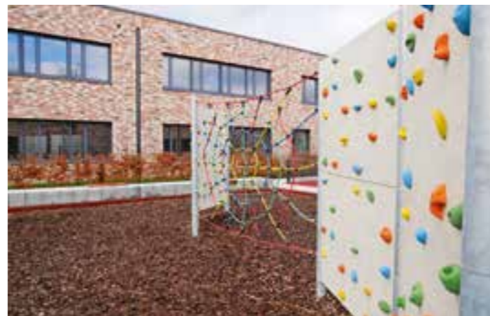
Schulhof der Schule.

dem neuesten Stand: „Wir können das Gebäude mit Energie und Wärme fast CO2-neutral versorgen“, sagt Baudezernent Ludwig Holzbeck, der auch immer die Umweltbilanz im Auge hat. „Der Neubau hat unter anderem eine Lüftungsanlage mit Wärmerückgewinnung sowie eine Photovoltaik-Anlage.“ Geplant hat das Architekturbüro Weicken den Neubau in U-Form. Mit der Architektur ist eine klare Linie zur einfachen Orientierung geschaffen worden. Es gibt viel Tageslicht und die Akustik ist durch eine Kombination „dämpfender“ Materialien optimiert worden. „Für uns als Schulträger ist das ein ganz wichtiges Bauprojekt. Es macht deutlich, dass wir in unsere Schul-Infrastruktur investieren und uns zukunftssicher aufstellen“, ergänzt Schuldezernent Holger Gutzeit. PK|PKU