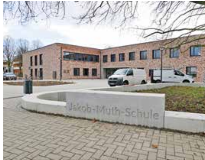
Eingang Jakob-Muth-Schule an der Döbelner Straße.

Am 20. Januar ist der Neubau an der Döbelner Straße feierlich eingeweiht worden. Ein paar Tage zuvor am 9. Januar konnten bereits die Lehrerinnen und Lehrer mit der Schülerschaft in das Gebäude – denn dann begann für sie der Unterricht. „Wie in einem Hotel haben sich die Schülerinnen und