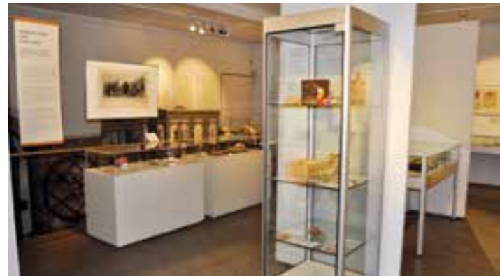
Hellweg-Museum Unna