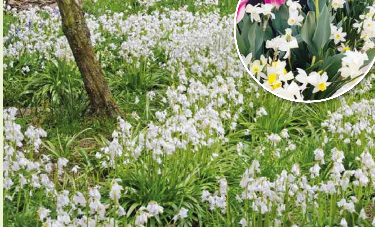
Das Spanische Hasenglöckchen ( Hyacinthoides hispanica ) ist äußerst robust.

Blüten über Blüten, soweit das Auge reicht – mit frühen Blumenzwiebeln und Knollen lassen sich eindrucksvolle Blütenmeere pflanzen. Im Idealfall wurden sie bereits im Herbst eingepflanzt, damit sie mit den ersten Sonnenstrahlen im neuen Jahr fröhlich austreiben. Wer diesen Schritt verpasst hat, kann sich auch jetzt noch vorgezogene Frühblüher besorgen und sie in Kübel für Balkon und Terrasse oder in die Beete setzen.