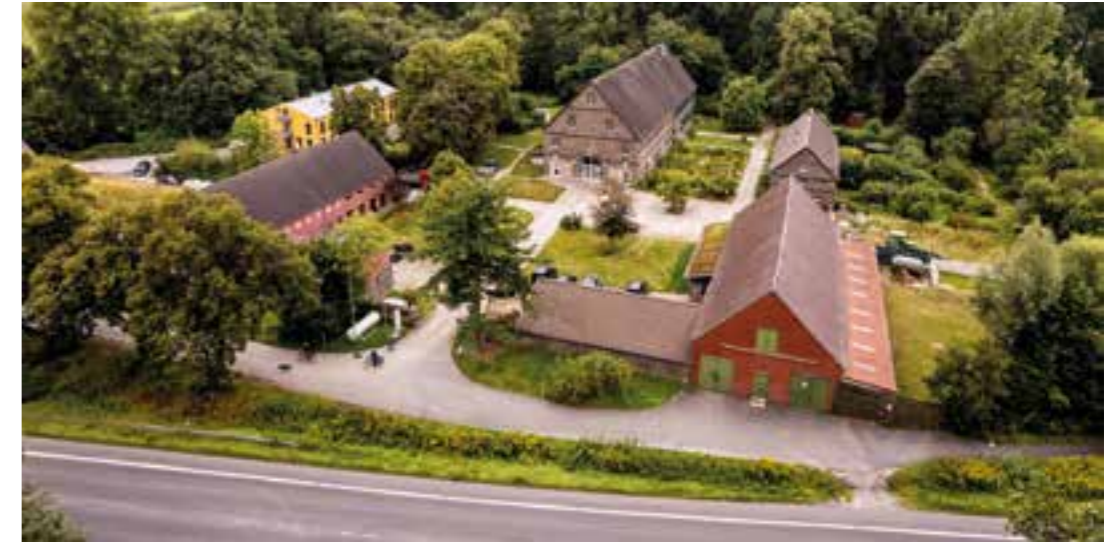
Bundesfreiwilligendienst (BFD) im Naturschutz.

fältig und umfasst neben der Naturschutzarbeit, Tätigkeiten im Bereich Landschafts- und Gewässerpflege, Nachhaltigkeit, Artenschutz sowie die Pflege und Wartung von Fahrzeugen, Maschinen und Geräten. Gearbei-