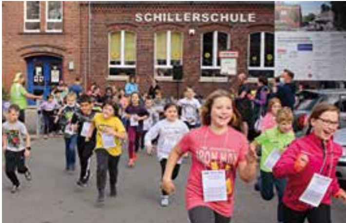
Mit viel Elan und Freude gingen auch die Viertklässler an den Start.