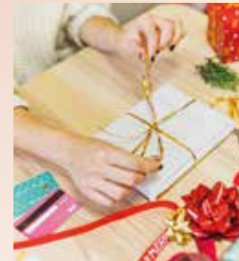
Entstresst die ganze Familie: Statt Bergen von Geschenken gibt es für jeden nur eines.

Mit Minimalismus und alten Kräuterrezepturen gut durch die festliche Zeit