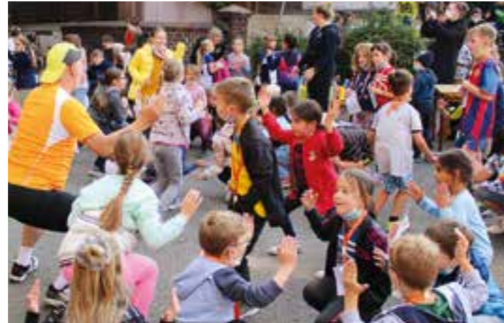
Mit Kniebeugen, Arme hoch und weiteren Lockerungsübungen bereiteten sich die Zweitklässler auf ihren Lauf vor.