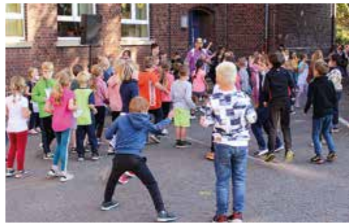
Erstklässler beim warm up.