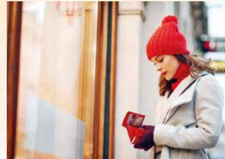
Der Shopping-Marathon zu Weihnachten ist mitunter purer Stress. Doch es geht auch anders.