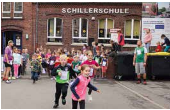
Start der Drittklässler.