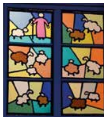
Grafiken: Ev. Kirchengemeinde Massen

Jeder ist willkommen! Es gelten die Regeln zum Infektions-