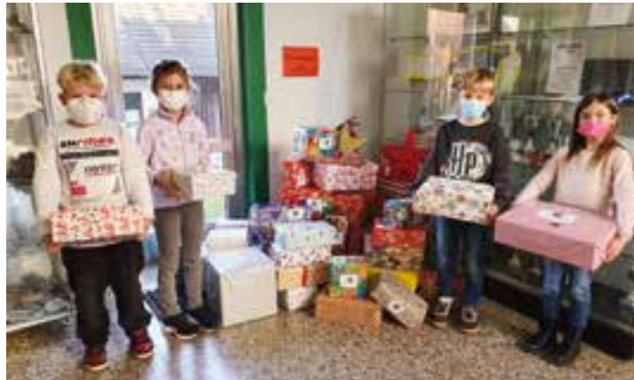
Die Kinder der Sonnenschule freuen sich anderen Kindern eine Freude zu bereiten.

Auch in diesem Jahr beteiligte sich die Sonnenschule wieder an der Sammelaktion für den Weihnachtspäckchenkonvoi.