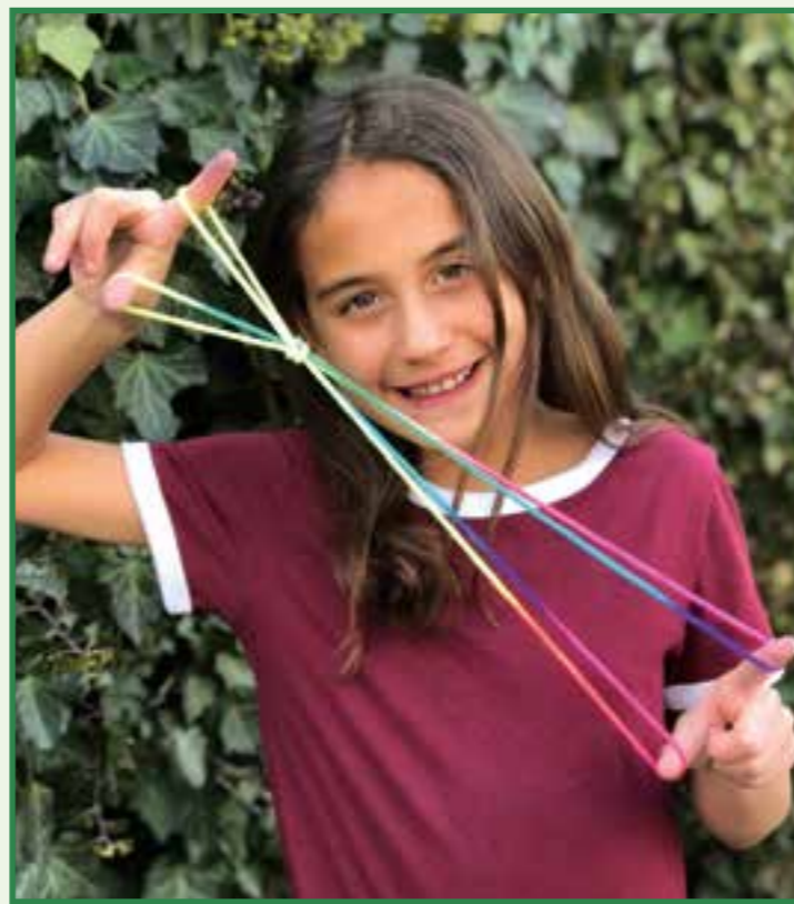
Das analoge Spiel mit den bunten Fäden fasziniert auch die erfolgreiche YouTuberin Miley von Mileys Welt.

Die bunten Ztringz finden auch bei der YouTuberin Miley („Mileys Welt“) große Begeisterung. Auch sie ließ sich von der Faszination des Fadenspiels anstecken. Wie früher schon geht es bei dem Spiel darum, mit einem bunten Seil durch Drehen und Wenden Figuren zu erschaffen. Dabei gibt es viele verschiedene Figuren mit unterschiedlichen Schwierigkeitsgraden, manche davon lassen sich nur zu zweit und mit vier Händen lösen. Echte Fingerspiel-Profis unter den Kindern und Jugendlichen von heute stellen dabei das Geschick ihrer Eltern locker in den Schatten. Rund um den Trend ist sogar die „Ztringz Academy“ in-