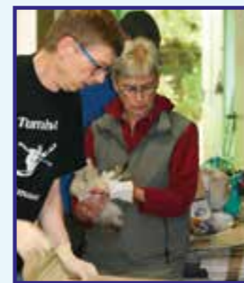
Die Ehrenämter vom NABU kümmern sich um verletzte Vögel, wie hier eine kleine Schleiereule.

sel oder eine Meise, solltet ihr ihn zum Tierarzt bringen. Diese versorgen die gefiederten Freunde sowie andere Wildtiere meist kostenlos. In der Vogelpflegestation werden die Tiere versorgt und ausgewildert, wenn sie wieder gesund sind. Unser kleiner Turmfalke „Kurti“ wird bald auch wieder fliegen, wenn er noch etwas Gewicht zugelegt hat. Wenn Ihr also einen verletzten Greifvogel findet, dann könnt ihr die Vogel-Retter aus Dortmund unter Tel. 0231/281195 erreichen.