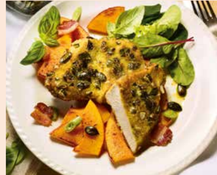
Eine Geflügel-Kürbis-Mahlzeit punktet mit wichtigen Vitaminen, die die Abwehrkräfte stärken.