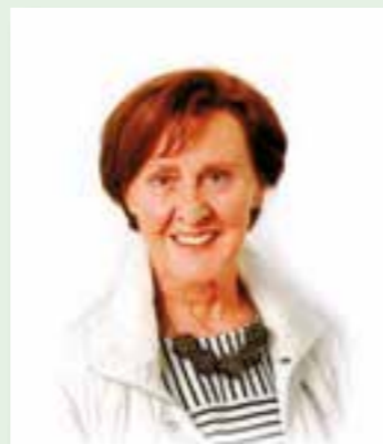
Bilder und Text zur Verfügung gestellt von Gabriele Schüttelkorb

Wie es mit Schabernack weitergeht, könnt ihr in der nächsten Ausgabe lesen.