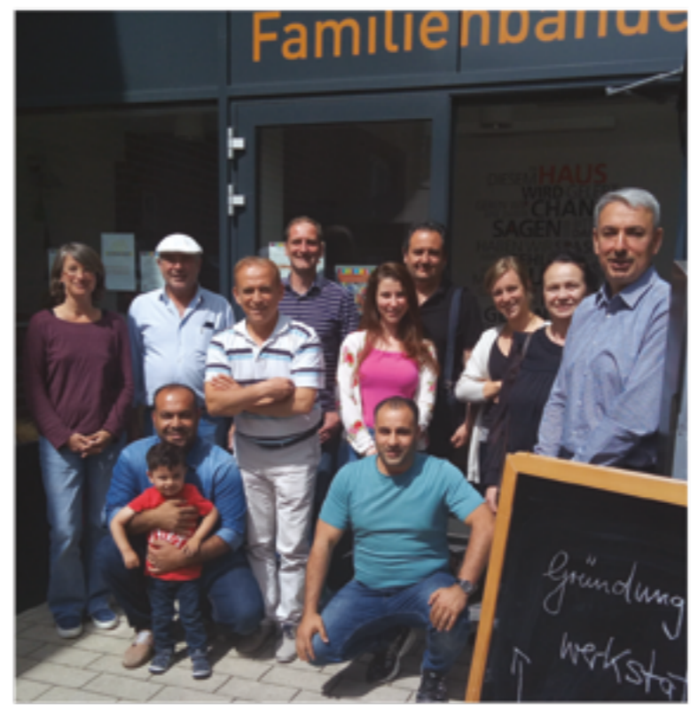
Die Gründungswerkstatt ist eine offene Sprechstunde, in der alle Fragen rund um die geplante Existenz- oder Geschäftsgründung beantwortet werden.