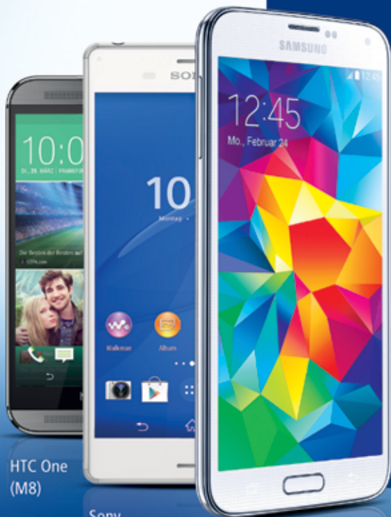
HTC One (M8)