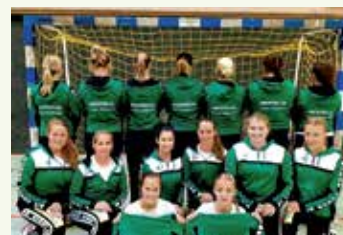
Handball Damen SG Unna-Massen