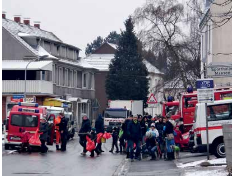
Gegen 9.15 Uhr brachen die ersten Müllsammler in der Mittelstraße auf.

Unter dem Eingesammelten befand sich in diesem Jahr nicht nur eine recht große Menge an Schnapsflaschen, auch bereits von den Haltern eingetüteter Hundekot wurde reichlich gesammelt. Und eigentlich ist das Aufnehmen der Hinterlassenschaften ja etwas Löbliches. „Die Stadt spart an Mülleimern und so landen die Plastikbeutel im Grünen“, so Tepe. Alles in allem brachten mittags drei gut gefüllte Fahrzeuge der Stadtbetriebe den Müll weg. Massen ist an diesem Wochenende wieder ein bisschen schöner geworden und nun fit für die Frühjahrs-Saison!