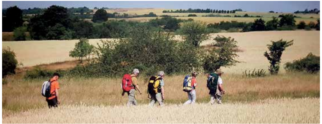
Unterwegs – alleine oder in den Gruppe.

„Grünkraft“, so nannte Hildegard von Bingen jenes innere Lebensgefühl, das wachsen und ge-