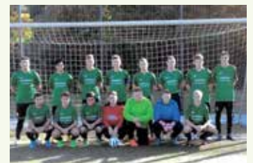
Fußball Jugend SG Unna-Massen