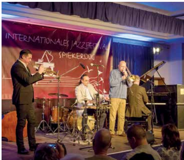
Klangerlebnis in besonderer Atmosphäre: Musikfreunde können mit der Diakonie zum internationalen Jazzfestival auf Spiekeroog fahren.

Darüber hinaus lädt Spiekeroog zu ausgedehnten Strandspaziergängen ein. Die Musikfreunde können auch das urige Inseldorf mit seinen vielfältigen Geschäften und Restaurants erkunden. Die Gäste übernachten während ihres Aufenthalts in Ferienwohnungen im diakonieeigenen „Haus am Meer“. Für die Reise zum Jazzfestival sind noch einige Plätze frei. Weitere Informationen gibt es unter Telefon 0800/5890257 oder reisen@diakonie-ruhr-hellweg.de sowie online unter www.diakonie-reisedienst.de .