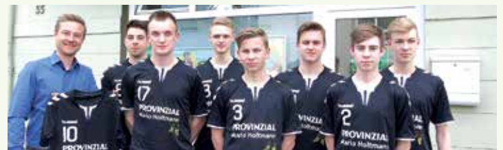
Handball A Jugend (Verbandliga Männer) SG Unna-Massen