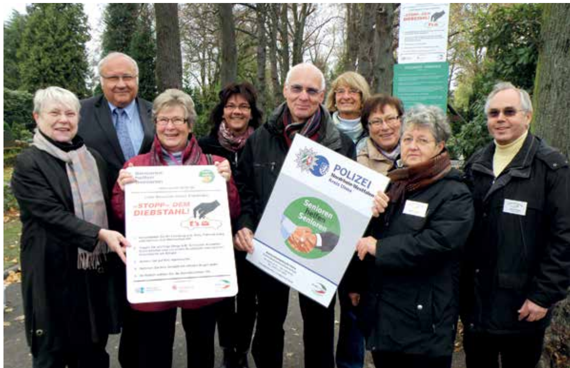
Auch auf Friedhöfen sind Seniorenberater präsent. Sie informieren hier zum Beispiel darüber, Taschen auch während der Arbeit „im Auge“ zu behalten.

Das Team der ehrenamtlich tätigen Seniorenberater soll auch in diesem Jahr wieder verstärkt werden. Und so bietet das Kommissariat Kriminalprävention/Opferschutz der Kreispolizeibehörde Unna im Frühjahr wieder ein Seminar für am Projekt „Senioren helfen Senioren“ (ShS) Interessierte an. Seniorinnen und Senioren können sich an diesem 23. Seminar, das über einen Zeitraum von fünf Tagen durchge-