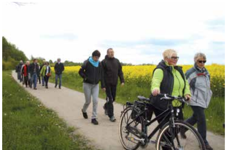
Zu Fuß und per Rad ging es im letzten Jahr beim Schnadegang nach Königsborn.

Von hier aus geht es dann nach Westen in Richtung Stadtgrenze, dann südlich über den Oelpfad, am Stollenmundloch des Caroliner Erbstollens vorbei, der dicht an der Stadtgrenze liegt. Über den (Massener) Stuckenberg kommen die Schnadegänger zur Schönen Flöte, die jeder Massener Schwimmbadfreund kennt. Auf einem kleinen Schlenker wird noch einmal Holzwickeder Bergbaugeschichte lebendig, dann geht es zum Rastplatz am Hilgenbaum. Was hat es mit die-