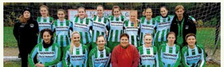
Fußball Damen SG Unna-Massen (Kreisliga A)