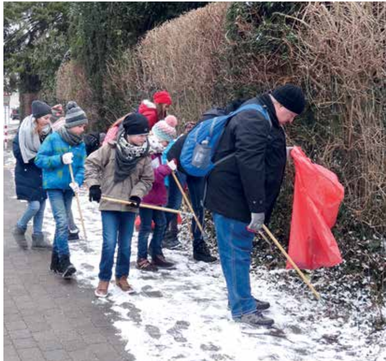
Entlang des Fritz-Steinhoff-Wegs suchten diese Helfer akribisch den verschneideten Grünstreifen ab.