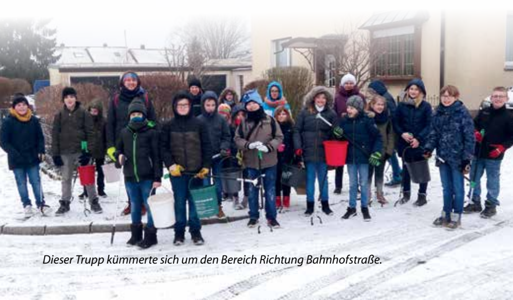
Dieser Trupp kümmerte sich um den Bereich Richtung Bahnhofstraße.