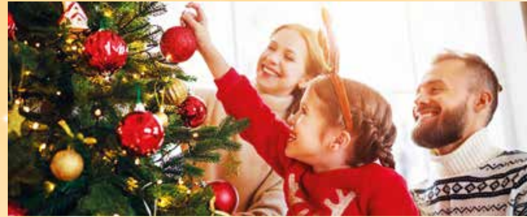
Sicher stehen sollte der Christbaum, damit man ihn mit allerlei festlicher Dekoration zum Funkeln bringen kann.

Christbaumständer und Baumdekoration: Tipps für ein gelungenes Weihnachten