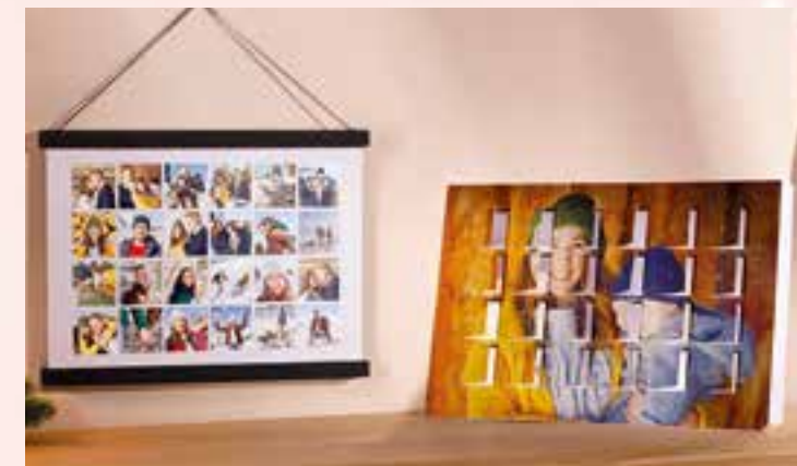
Persönliche Fotos verkürzen die Zeit bis zum Weihnachtsfest und bereiten als Poster-Collage das ganze Jahr über Freude.

Adventskalender individuell gestalten und mit eigenen Fotos verschönern