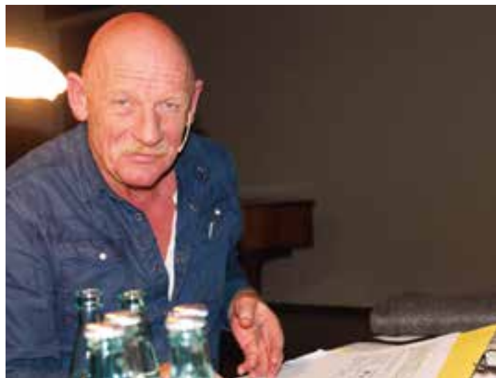
TV-„Tatort-Pathologe“ Joe Bausch liest am 6. Februar 2024 in der LWL-Klinik Dortmund aus seinen Büchern. Der Vorverkauf ist bereits gestartet.

Am Dienstag, den 6. Februar 2024, liest er Passagen aus seinen drei Büchern und erzählt von seinem bewegten Leben und von Erlebnissen mit Straftätern. Ob in „Knast“, „Gangster-