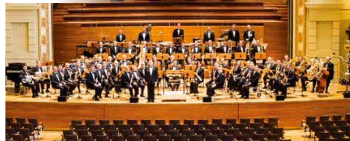
Das Musikkorps der Bundeswehr blickt nunmehr auf mehr als 60 Jahre erfolgreiche militärische Tätigkeit zurück. Mit jährlich rund 50 Konzerten im In- und Ausland begeistert das Musikkorps mit seinem breit gefächerten Repertoire.

Das Musikkorps der Bundeswehr Siegburg kommt am Dienstag, den 16. April 2024 , um 20:00 Uhr in die Erich-Göpfert-Stadthalle, Parkstraße 44 in Unna. Einlass für das Konzert ist um 19:00 Uhr. Das Musikkorps der Bundeswehr gilt als das renommierteste Konzertblasorchester Deutschlands mit großer internationaler Reputation. Seine musikalische Bandbreite reicht von traditioneller Orchestermusik über Arrangements aus Rock und Pop bis hin zu anspruchsvollen eigenen Kompositionen.