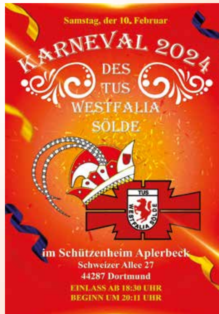
Plakat: TuS Westfalia Sölde

(DO, Rheinische Straße 24, Achtung: Öffnungszeiten bitte im Internet nachschauen), und im Klinik-Café „Big Apple“ auf dem Gelände der LWL-Klinik. Die Lesung am 6. Februar 2024 beginnt um 19:00 Uhr in der LWL-Klinik Dortmund, Marsbruchstraße 176. (lwl)