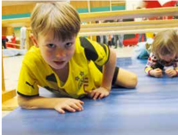
Für Kinder bis ins Grundschulalter bietet der HSC in Kooperation mit der AOK an drei Terminen Sportel-Sonntage in der Sporthalle der Nordschule an.