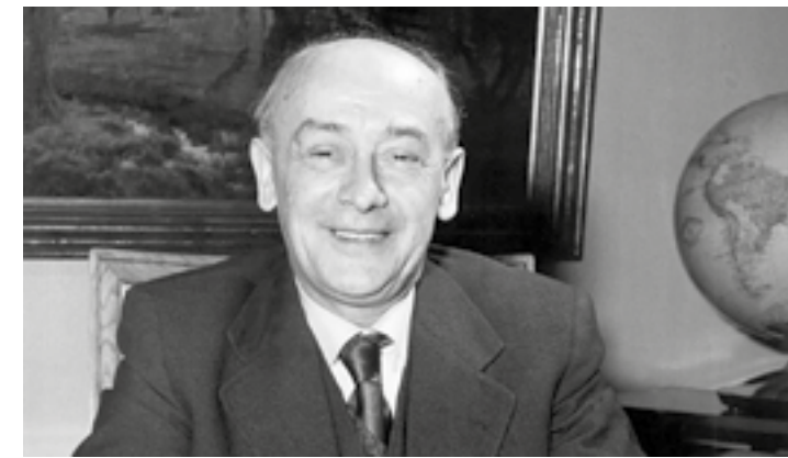
Fritz Steinhoff - Ministerpräsident

tagsabgeordneter und Wiederaufbauminister. 1956 wurde er von der ersten sozialliberalen Koalition auf Landesebene zum Ministerpräsidenten von Nordrhein-Westfalen gewählt. Am Ende seines bewegten Lebens gehörte Fritz Steinhoff acht Jahre lang dem Bundestag an. Durchgehend setzte sich Fritz Steinhoff für seine Mitmenschen