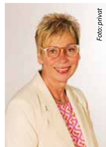
Ihre Ulrike Drossel Bürgermeisterin