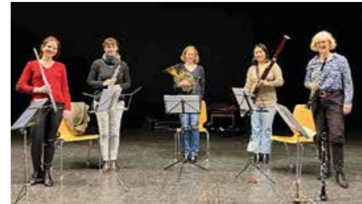
Das Bläserquintett „Effonia“.

Der gute Ton hat im Kreis Unna eine lange Tradition – so auch die Kammermusikalische Reihe.