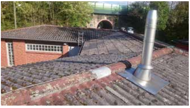
Der Kabinentrakt des Fußballvereins VFR Sölde vor der Sanierung mit einem Wellplattendach aus Asbestfasern.