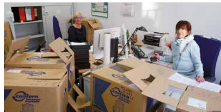
In der Kämmerei stapelten sich die Kartons.