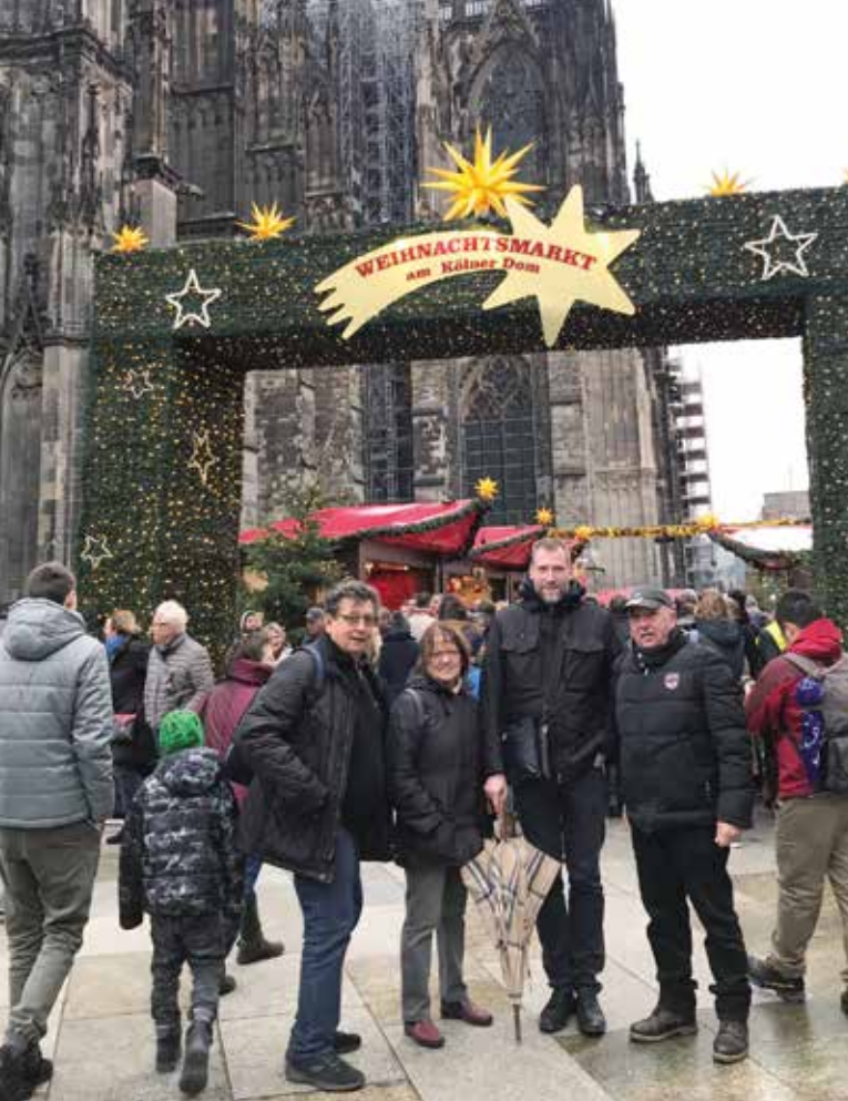
Für die Radsportabteilung des HSC ging der Adventsausflug 2018 zum Weihnachtsmarkt nach Köln. Vereinsmitglieder, Familienangehörige und Helfer aus Nachbarvereinen, besuchten zunächst das Schokoladenmuseum in Köln, bevor es mit der Kölner Bimmelbahn zu den vier Weihnachtsmärkten ging. Bei unbeständigem Wetter schob man sich von einem Büdchen zum nächsten oder kehrte im Brauhaus Früh zu einem Kölsch ein. Zurück in Holzwickede wartete ein weihnachtliches Buffet im Hillering 42 auf die 30 Teilnehmer.