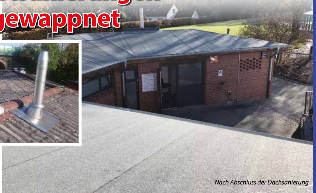
Nach Abschluss der Dachsanierung

Seit 1993 ist Asbest (altgriechisch: „unvergänglich“) in Deutschland verboten. Der Grund: Der eingeatmete Faserfeinstaub kann Lungenkrebs verursachen. Hierzulande sind Millionen Tonnen asbesthaltiger Materialien verbaut worden. Ein Großteil davon