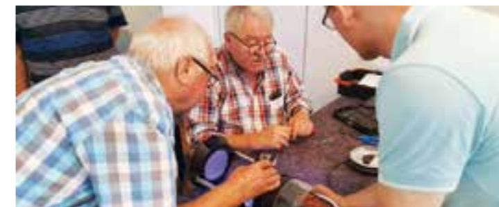
Die Mitarbeitenden im Repair Café Wambel stellen ihr Wissen bei der Reparatur von defekten Geräten, die möglichst vor Ort im Ev. Jakobus Gemeindehaus repariert werden können, zur Verfügung.

Repair Café im Jakobus Gemeindehaus Wambel