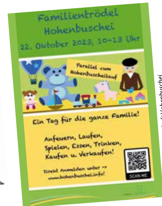
Plakate: Siedlungsgemeinschaft Hohenbuschei