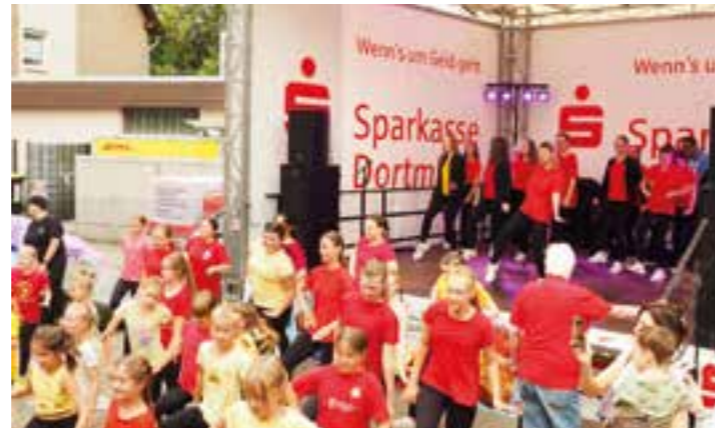
KG Rot-Gold mit einer Tanzvorführung auf der Bühne und davor.