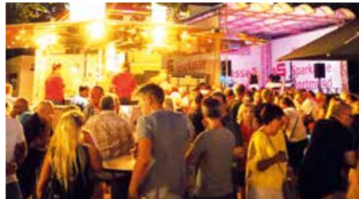
Ausgelassene Stimmung herrschte am ersten Festtag beim Sommerfest der Vereine.

Auf einem separat aufgebauten Spielfeld und auch auf der Bühne konnten die Zuschauer sehen, wie Kinder und Jugendliche sich in den verschiedenen Sportarten engagieren können. Ab Spätnachmittag war es dann leider mit dem bis dahin trockenem Wetter vorbei, ein Dauerregen setzte ein, der erst nach 20:00 Uhr langsam aufhörte. Dadurch war natürlich die Besucherzahl für den Abend deutlich verringert, was alle Aktiven bedau-