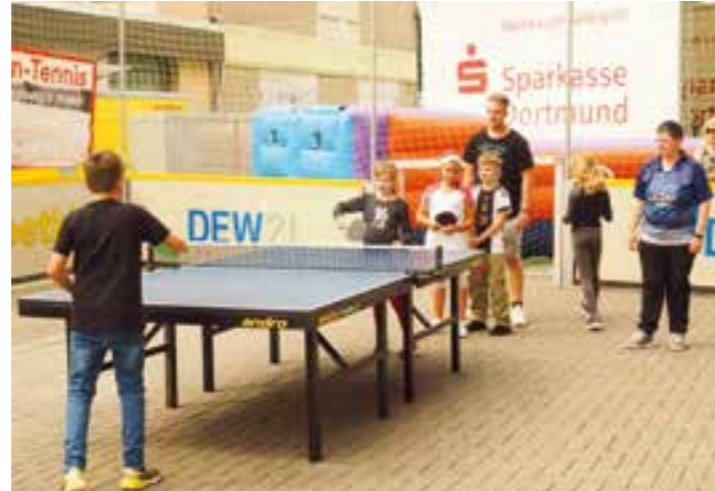
Der Tischtennis Club Wickede (TTC) zeigt, wie Tischtennis gespielt wird.

soren konnte das erste Fassbier angestochen werden. Bei noch gutem Wetter wurde dann bis in die Abendstunden fröhlich mit musikalischer Unterhaltung gefeiert. Der zweite Tag startete mit einem Mitmach-Programm verschiedener Sportvereine: Westfalia Wickede, der TC Grüningsweg, TTC Dortmund-Wickede, TV Arminius und KG Rot-Gold zeigten, was die einzelnen Vereine an Möglichkeiten für den Nachwuchs bieten.