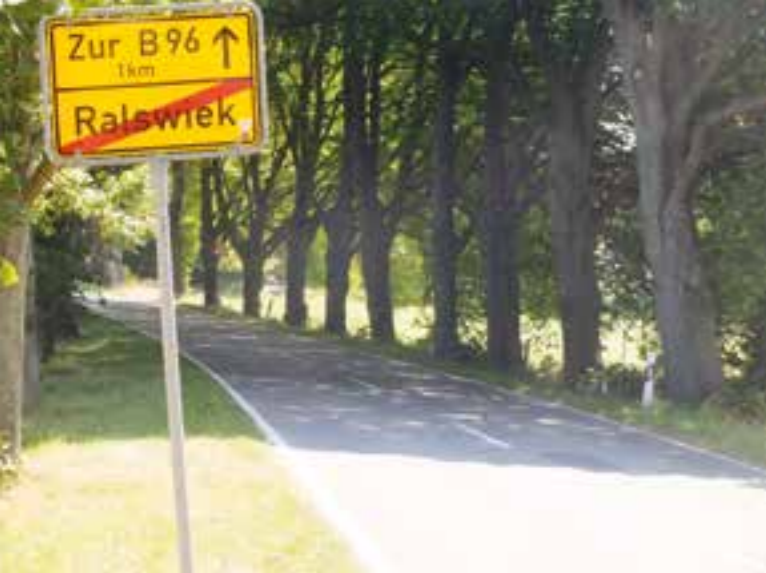
Alleen - wunderschön, jedoch für Radfahrer gefährlich