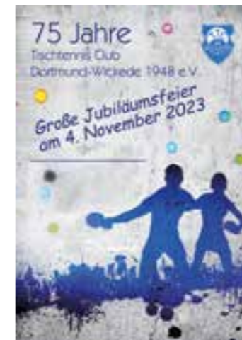
Die Jubiläumsfeier findet am 4. November statt. Plakat: TTC

Am Samstag, den 4. November 2023 beschließt der TTC Dortmund-Wickede 1948 e.V. sein Jubiläumsjahr mit einem großen Vereinsfest in der Eventlocation Deifuh.