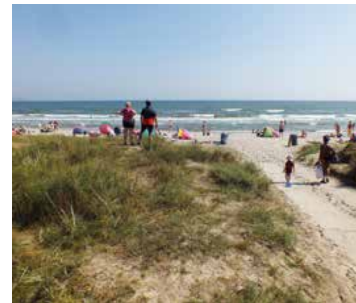
Prora - schönster Sandstrand an der Ostsee

Eisenbahnfahrten aus Klaipėda an. Es waren besondere Fährschiffe - in ihnen gab es versteckte Decks für je 300 Soldaten und sie hatten