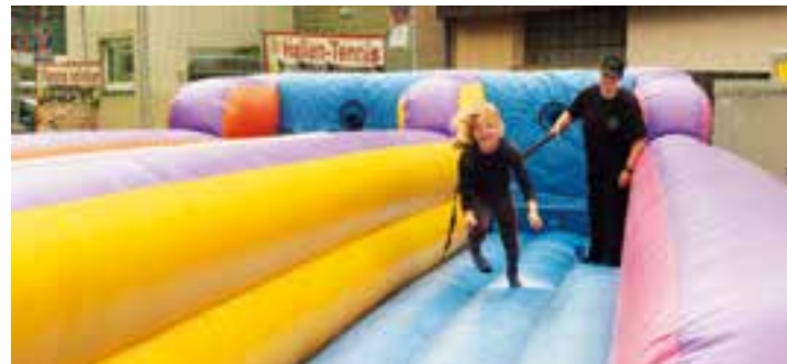
Ein Festhighlight für die Kinder: Bungee Running.