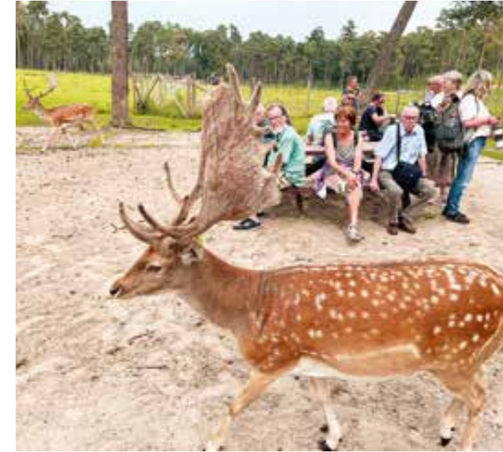
Jubiläumsausflug am 19. August.

so und das macht einen Verein wie den unseren aus. Tischtennis ist seit jeher eine hoch integrative und inklusive Sportart, was sich auch in unserem Verein widerspiegelt. Ohne solche Eigenschaften als besonderes Projekt zu verkaufen, war der TTC Dortmund-Wickede immer für alle da. Insgesamt waren über 1.250 Menschen Mitglieder in unserem Verein und so ist es auch zu erklären, dass der TTC zwar 75 Jahre auf dem Buckel hat, aber nicht wirklich „alt“ ist.“ Im Jubiläumsjahr fand neben