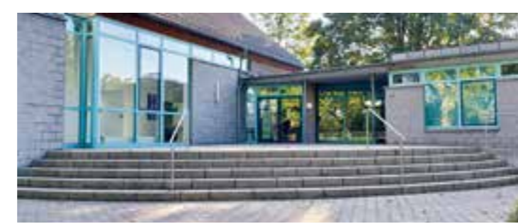
Das Jakobus Gemeindehaus ist neben Treppenstufen auch mit einer Rampe für alle Rollstuhl- und Rollatorfahrenden barrierefrei zu allen Veranstaltungen erreichbar.

Jeweils dienstags, in der Zeit von 13:00 bis 15:00 Uhr bietet das Seniorenbüro Brackel Außensprechstunden im Ev. Jakobus Gemeindehaus in Wambel, Eichendorffstraße 31 an.