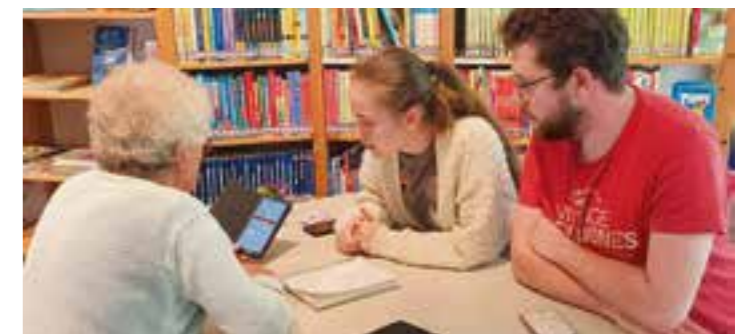
Regelmäßige Handy- und Smartphone-Sprechstunden gehören ebenfalls zum festen Bestandteil des Angebots im Repair Café Wambel.

Am Freitag, den 27. Oktober findet um 16:00 Uhr das nächste Repair Café Wambel im Ev. Jakobus Gemeindehaus, Eichendorffstraße 31 statt.