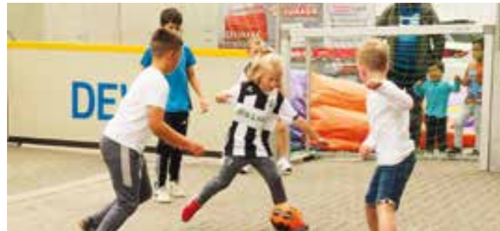
Westfalia Wickede war mit Street Soccer dabei, was gut bei den Kindern ankam.

Auch in diesem Jahr veranstaltete die Interessengemeinschaft Wickeder Vereine e.V. (IWV) ihr Sommerfest der Vereine im Zentrum von Wickede.