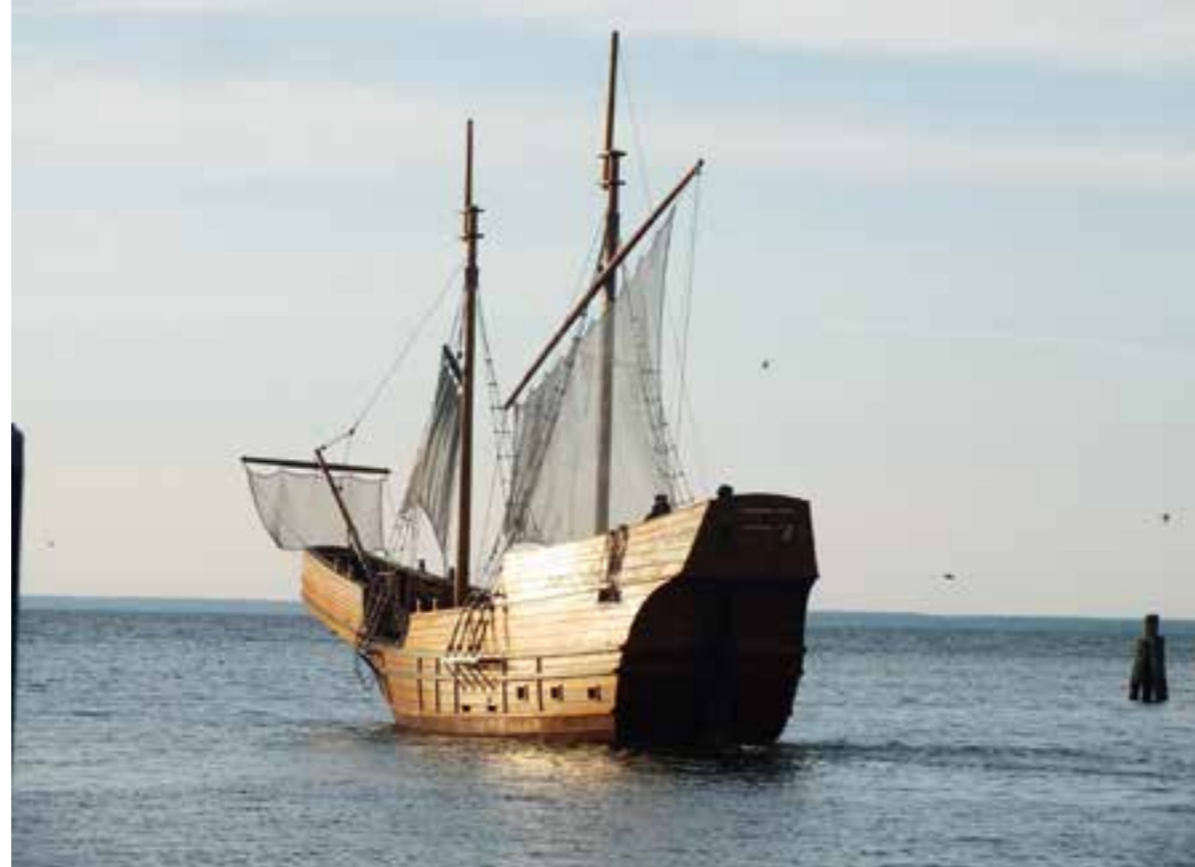
Piraten-Kogge auf dem Jasmunder Bodden

hat. Mit dem Fahrrad kann man sich die Insel prima erschließen, es gibt sehr gute Radwege. Aber manchmal sind es schöne Alleen - ohne Platz für den Radweg! Und hier wird schnell gefahren, sehr schnell, manchmal bleibt nur die Flucht in das Grün. Trotzdem: die Tour zum Kap Arkona ist wunderbar! Unterwegs überall unübersehbare Zeichen der frühen Besiedlung, so eines der größten Steingräber Norddeutschlands, der Riesenberg von Nobbinn direkt am Tromper Wiek. Schnell ist man in Vitt, einem malerischen Fischerdorf mit spektakulärem Blick auf Kap Arkona. Den berühmten Leuchtturm kann man besteigen - 175 durchnumme-