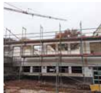
Das entkernte Stephanus Gemeindeganztag zur Beginn der Bauphase.

Nach 15-monatiger Bauphase steht die Eröffnung des „Ev. Kindergarten im Steph Meylantstraße“ kurz bevor.