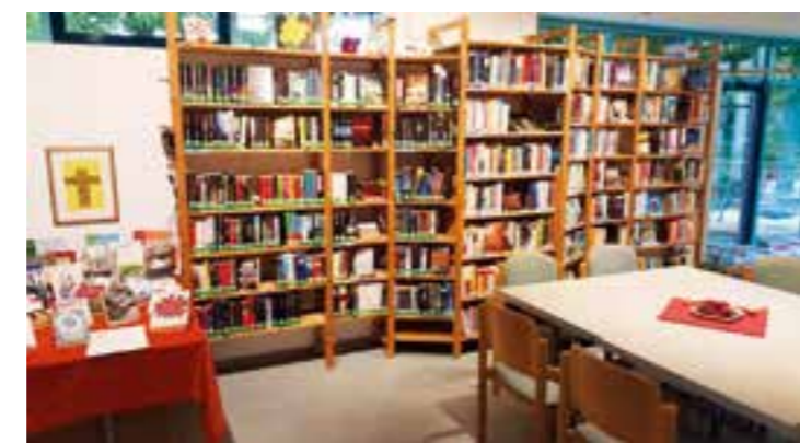
Die Außensprechstunden des Seniorenbüros Brackel für Ratsuchende im Stadtteil Wambel finden im vertraulichen Rahmen in der Gemeindebücherei „Die Leseratte“ statt.