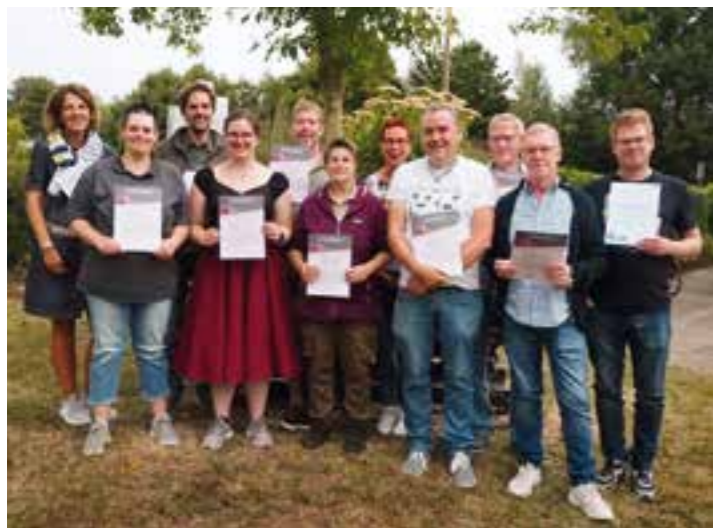
Die Vereinsmeister 2022.

Im August konnte der Tischtennisclub Dortmund-Wickede (TTC) nach zweijähriger Pause sein traditionelles Sommerfest starten.