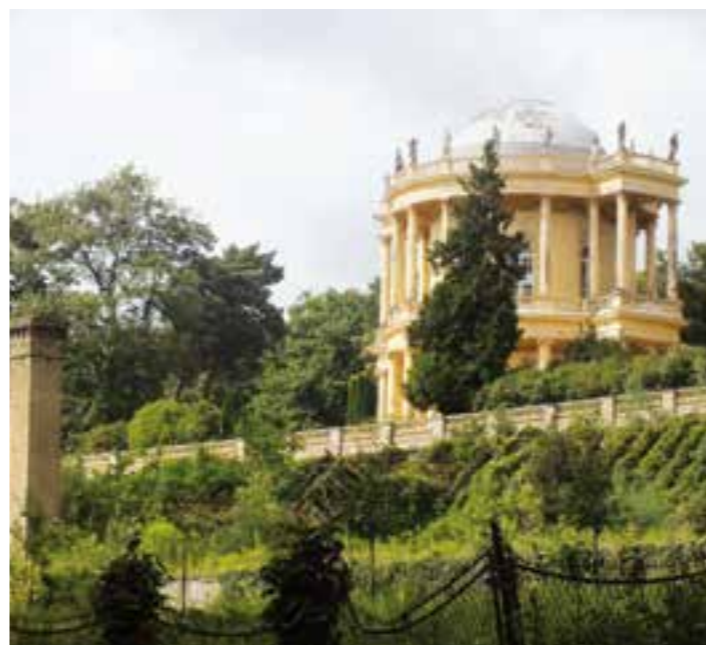
Belvedere auf dem Klausberg.

send, es kamen Busladungen von Hohenzollern mit Kind und Kegel und natürlich gab es viele Proteste - es kommt ja nicht jeden Tag ein Preußenkönig in Potsdam an. Die wechselvolle Vergangenheit des Hauses Hohenzollern, die fatalen Fehlentscheidungen und -entwicklungen, die losgetretenen Kriege - sie sind unvergessen, entsprechend groß war die Präsenz auch der Sicherheitskräfte. Das Ausland berichtete live. Auf jeden Fall ist er nun da wo er hin wollte und noch immer legen Besucher Kartoffeln auf die schlichte Grabplatte. Denn auch das ist unvergessen: durch seine Kartoffelbefehle konnte er den Hunger der einfachen Menschen stoppen, er schaffte die Folter ab und begann mit der Beendigung der Leibei-