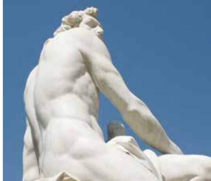
Nähert man sich dem Rondell auf der „Achse der Erkenntnis“ von Süden nach Norden, dann begegnet man zuerst dem Herrscherpaar Jupiter (Zeus) mit Io (auf dem Bild) und Juno (Hera) in einer delikaten Situation.

die machen manchmal ihr eigenes Ding. Sein Sohn ließ ihn in der Potsdamer Garnisonkirche neben dem ungeliebten Vater beisetzen. Mehrmals zog er um, kriegsbedingt wurde er sogar in einem Salzbergwerk zwischengelagert. Die amerikanischen Soldaten sollen sehr erschrocken gewesen sein, als sie ahnungslos den Deckel der Kiste öffneten. 1952 ging es auf die Burg Hohenzollern. Erst 1991, nach der Wiedervereinigung, an seinem 205. Todestag wurde der Alte Fritz endlich und hoffentlich endgültig in Sanssouci beigesetzt. Allerdings auch nicht so ganz wunschgemäß. Ohne Pomp - in unserem medienverrückten Zeitalter war das nicht zu machen. Neben Kanzler Kohl waren etliche Prominente anwe-