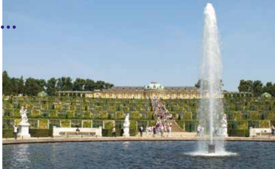
Schloss Sanssouci in Potsdam, die Sommerresidenz von Friedrich dem Großen, seit 1990 UNESCO-Welterbe.

Für diese Sommerresidenz mit angeschlossener Gruft, das „Weinberghäuschen auf dem wüsten Berg“ hatte der Monarch genaue Vorstellungen. Die gemeinsame Planung mit Wenzelslaus von Knobelsdorff, Preußens berühmtem Architekten, soll daher nicht ganz konfliktfrei abgelaufen sein. Jedenfalls entstand ein „einfaches Lusthaus zu Potsdam“, das allerdings in den kommenden Jahrhunderten vielfältigen Änderungen durch die Nachkommen unterworfen wurde, wie auch die gesamte Umgebung durch eine große Zahl von Schlössern, Lustschlösschen, Gartenhäusern und anderen Bauwerken ergänzt wurde. So entstand das, was heute als das Preußische Versailles, seit 1990 UNESCO-Welterbe, den Höhepunkt der Landeshauptstadt Potsdam darstellt. Denn diese Bauwerke liegen in einem riesigen Garten, dessen Anfänge auf Peter Joseph Lenné zurückgehen, jenen legendären Landschaftsarchitekten, der ein halbes Jahrhundert preußische Gartenkunst prägte und auch für uns im Ruhrgebiet von Bedeutung ist, gilt er doch als Vater des „Pantoffelgrüns“. Wer die Parklandschaft durch das Grüne Tor betritt, steht schnell vor der Großen Fontäne, deren Technik die Erbauer schier in den Wahnsinn trieb. Nie ließ sich die an-