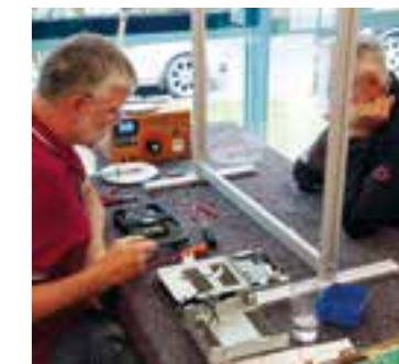
Vielfältige Reparaturanfragen kamen auch beim 50. Repair Cafe in Wambel wieder bei den freiwilligen Reparatoren an.