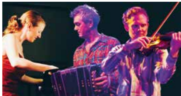
Am 4. November sorgt die Musikformation „Narcotango“ mit Bandoneon, Piano und Violine für einen einmaligen Tangoabend.