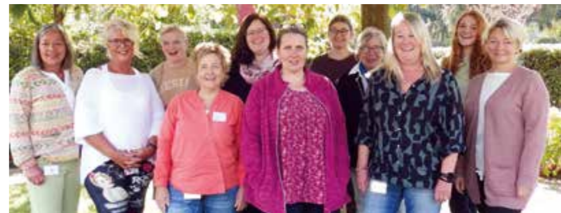
Das Team der LWL-Tagesklinik Brackel im Garten der Einrichtung.

Die gerontopsychiatrische Tagesklinik des LWL in Dortmund-Brackel wird 20 Jahre alt.