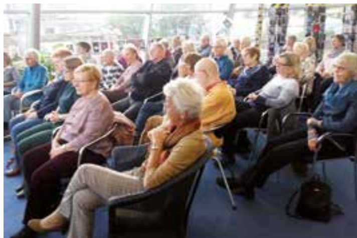
Mehr als 30 literaturbegeisterte Besucherinnen und Besucher trafen sich wieder im Cafe LeseLust.

Der Inhalt des Buches war zugleich Einstimmung und Vorbereitung auf den anstehenden Literaturgottesdienst im Rahmen der Veranstaltungsreihe Leben