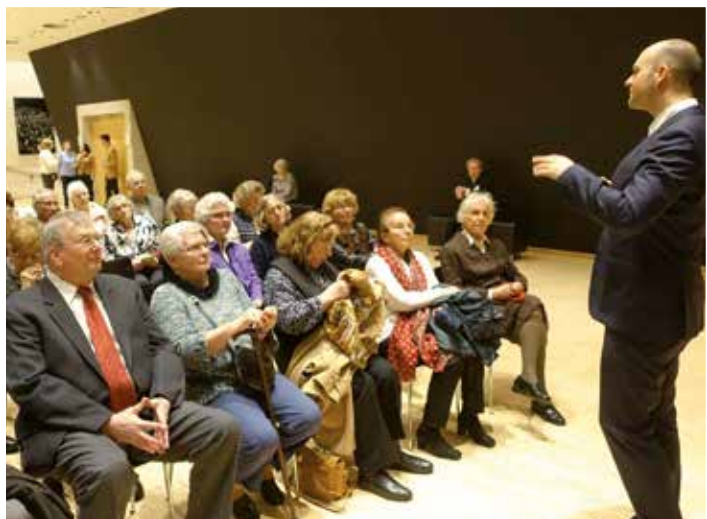
Einführung in das Konzert „Wiener Klassik“ durch den Orchestermanager.

Anmeldungen werden bis zum 13. April 2016 im Marie-Juchacz-Haus oder unter der Rufnummer 0231/27574 entgegen genommen.