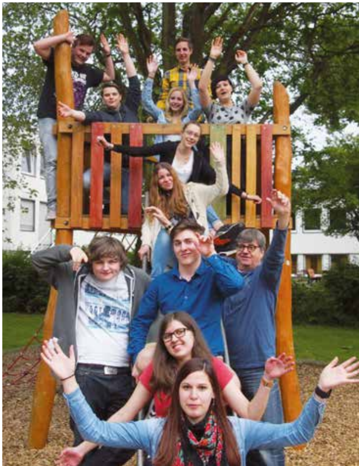
Die Jugendfreizeit der Evangelischen Kirchengemeinde Dortmund-Wickede fand im letzten Jahr in Finnland statt.