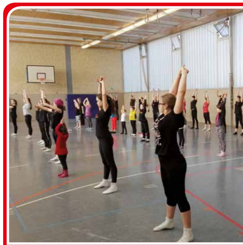
Beim Schnuppertraining der Karnevals-Gesellschaft „Rot-Gold“ für Garde- und Showtanz in der Turnhalle der Steinrink-Grundschule haben über 60 Jugendliche teilgenommen. Somit ist sicherlich für Nachwuchs gesorgt.