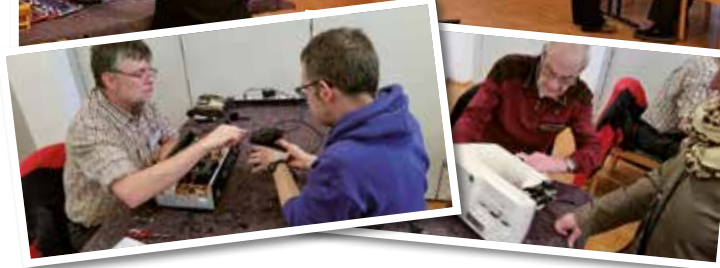
Viel zu tun gab es wieder im Ev. Gemeindehaus Wambel für die freiwilligen Reparatoren des beliebten Repair Cafes.

die glücklichen Besitzer wieder „Gerät läuft“. In sieben Fällen wird eine Wiedervorstellung mit Einbau eines Ersatzteiles zum erhofften Erfolg führen, lediglich in acht Fällen konnte eine Reparatur nicht mehr durchgeführt werden.