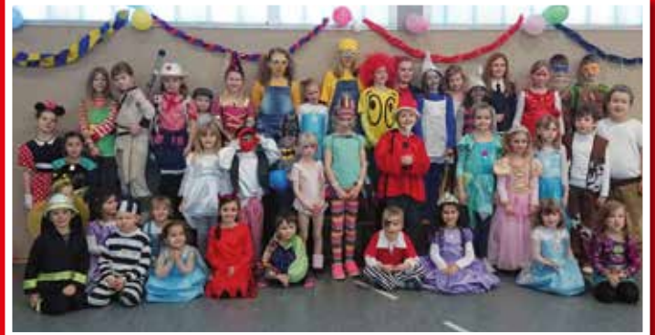
Im Februar fand in der Turnhalle der Steinbrinkgrundschule die Karnevalsfeier der TVA-Jugend statt. Die zahlreichen Betreuer und Helfer konnten rund 40 Kinder begrüßen. Auch dieses Jahr wurde wieder viel getanzt und gespielt.