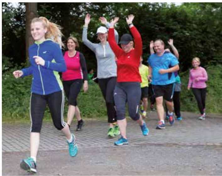
Erfolgreicher Abschluss der Läufer des LWT Dortmund im vergangenen Jahr.

Weitere Infos bzw. Anmeldung unter www.lwt-dortmund-ost.de .